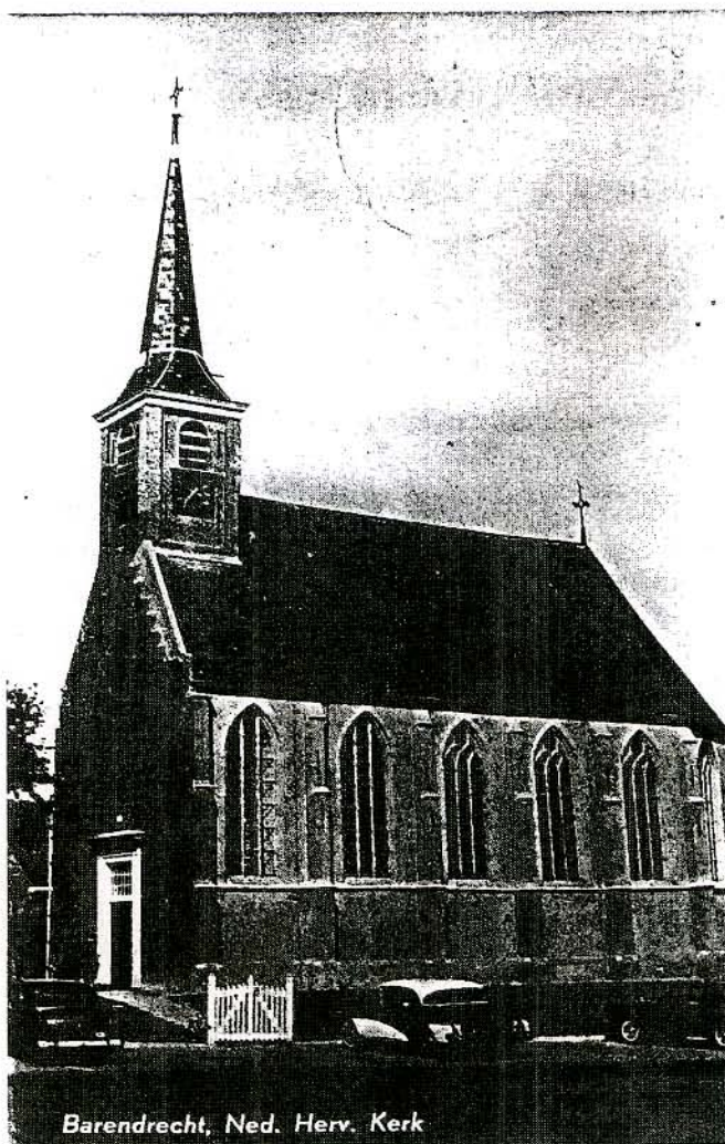
Barendrecht, Ned. Herv. Kerk